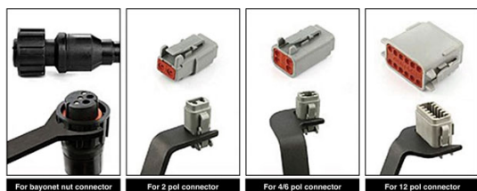
For bayonet nut connector